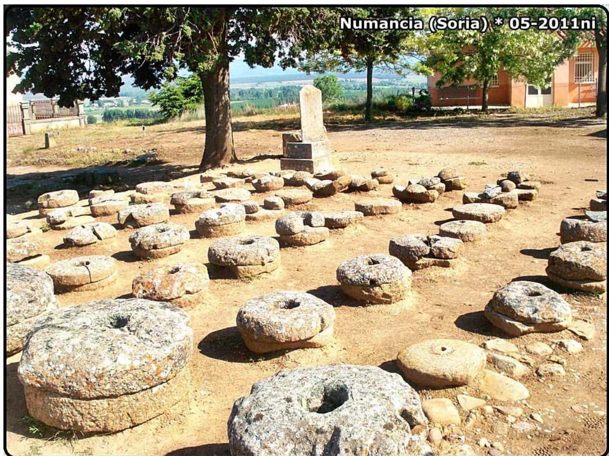
Piedras circulares de molino de mano, para moler el grano. La dieta era rica en vegetales, sobre todo en frutos secos y la bebida era cerveza extraída de trigo fermentado.