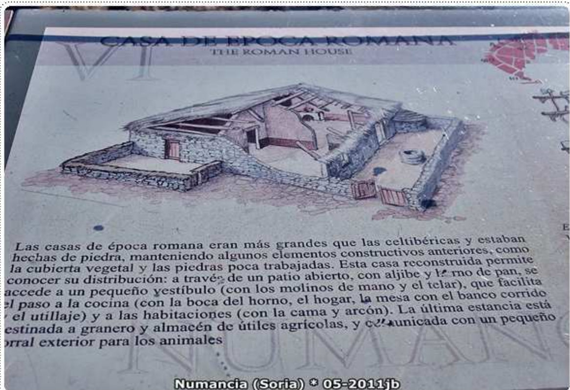
Numancia (Soria) * 05-2011jb