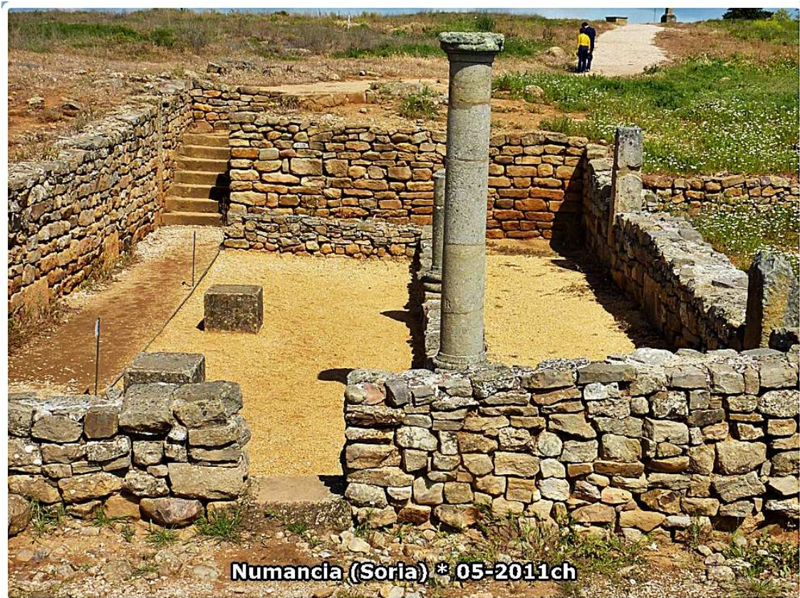
Casa Columnas del barrio sur: Típico patio de casa romana señorial orientada al sol con la vivienda detrás y más elevada.