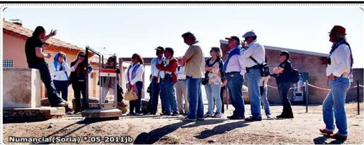
Numancia (Soria) * 05-2011jb